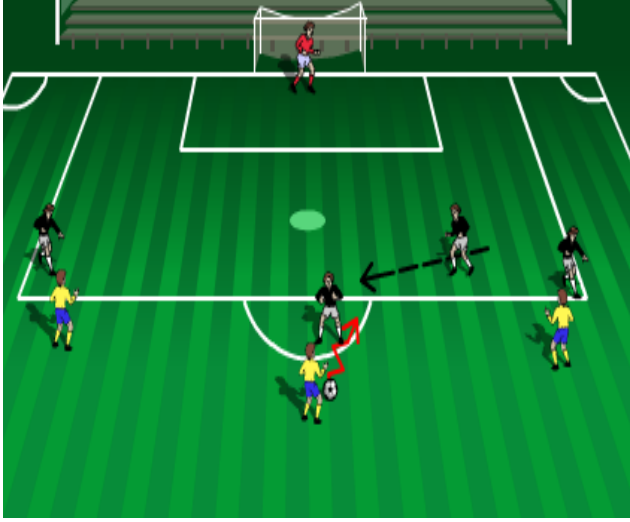
( التغطية الجماعية )