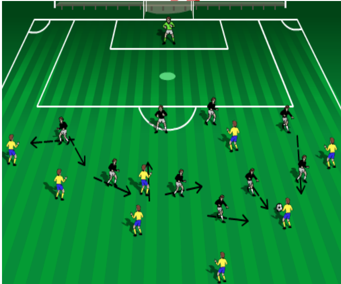
(مهارة تضيق المساحات)

وهي من المهارات الخططية الدفاعية وتعني التقارب وتضييق المساحة والوقت وتقليل فرص تحركات المهاجم المنافس وبالتالي سوف يقلل من الثغرات بين المدافعين وإعاقة تصرف المهاجم بالكرة وإن التأثير بالمساحة والوقت يكون من جانب المدافع حيث كلما كان التنظيم والموازنة بين المدافعين جيد ومتقارب لا يعطي الفائدة للمنافس وهذا يؤثر على مهارات وإمكانية المهاجم وإن كان يملك مهارات هجومية عالية وجيده إلا إن المساحة والتضييق تشكل ضغطاً مضافاً غير مباشر عليه يجعله يفكر عدة مرات بالدخول لهذه المناطق والبحث عن فرص أخرى على المرمى وإيجاد بدائل مثل لعب الكرات الطويلة خلف الدفاع وتجاوزهم