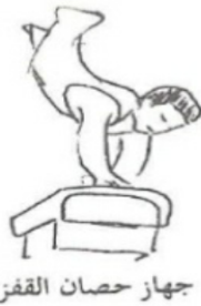
جهاز حصان القفز