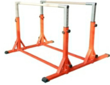
المتوازي المختلف الارتفاع