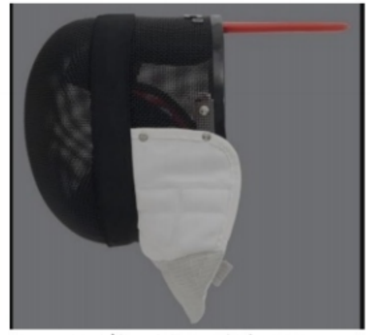
قناع سلاح الشيش