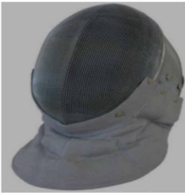
قناع سلاح السيف