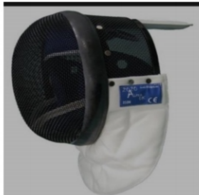
قناع سلاح سيف المبارزة