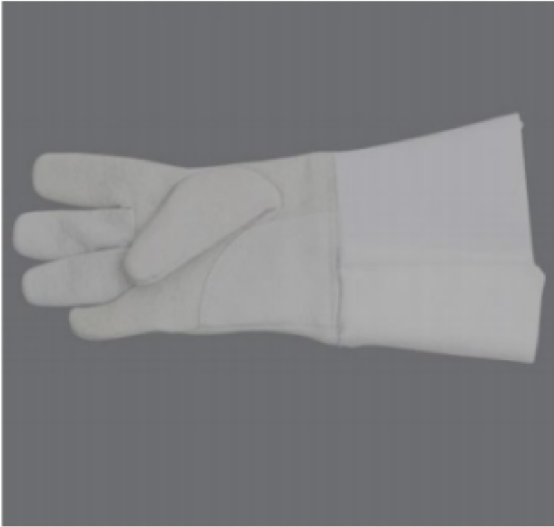
قفازات لاعب المبارزة :

* - في سلاح السيف الكهربائي هناك جراب مصنوع من نفس خامة القماش الموصل للكهرباء بحيث يثبت هذا الجراب على رسغ اليد المسلحة لدخولها ضمن الهدف المسموح للمس فيه.