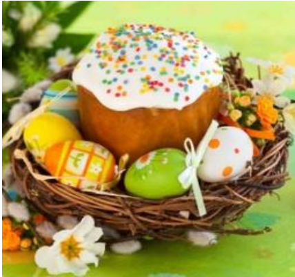
Кулич и крашеные яйца

есть пищу животного происхождения: мясо, яйца, молочные продукты.