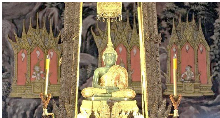
Статуя изумрудного Будды

Главная туристическая достопримечательность в Бангкоке – это Большой Королевский Дворец и Храм изумрудного Будды.