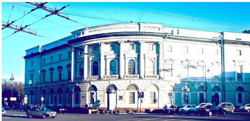
Российская национальная библиотека

Петра Великого. В Санкт-Петербурге много научно-исследовательских институтов (НИИ): научно-исследовательский институт математики и механики имени академика В. И. Смирнова, Арктический и антарктический научно-исследовательский институт и т.д.