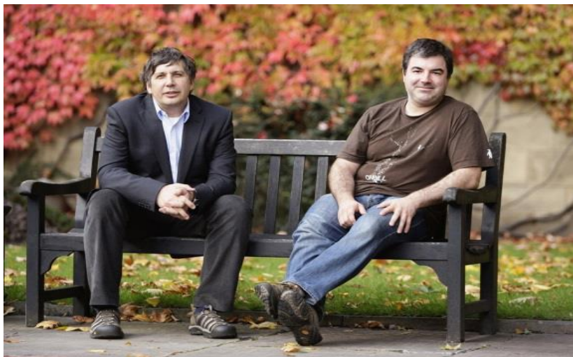
Андрей Гейм и Константин Новоселов

В 2003 году А.А. Абрикосов и В.Л. Гинзбург тоже получили Нобелевскую премию за вклад в теорию сверхпроводников и сверхтекучих жидкостей.