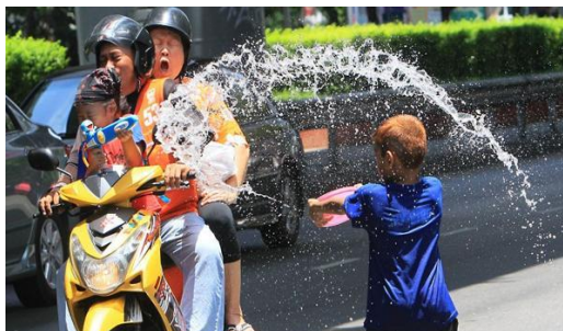
Тайский Новый год

Сонгкран – традиционный тайский Новый год. Его празднуют с 13 по 15 апреля. А 14 апреля – это день семьи. По традиции тайцы шьют новые костюмы и платья. Перед новым годом убирают улицы, дворы, моют окна и стены. Молодежь желает старшим крепкого здоровья и долгих лет жизни. Старшие