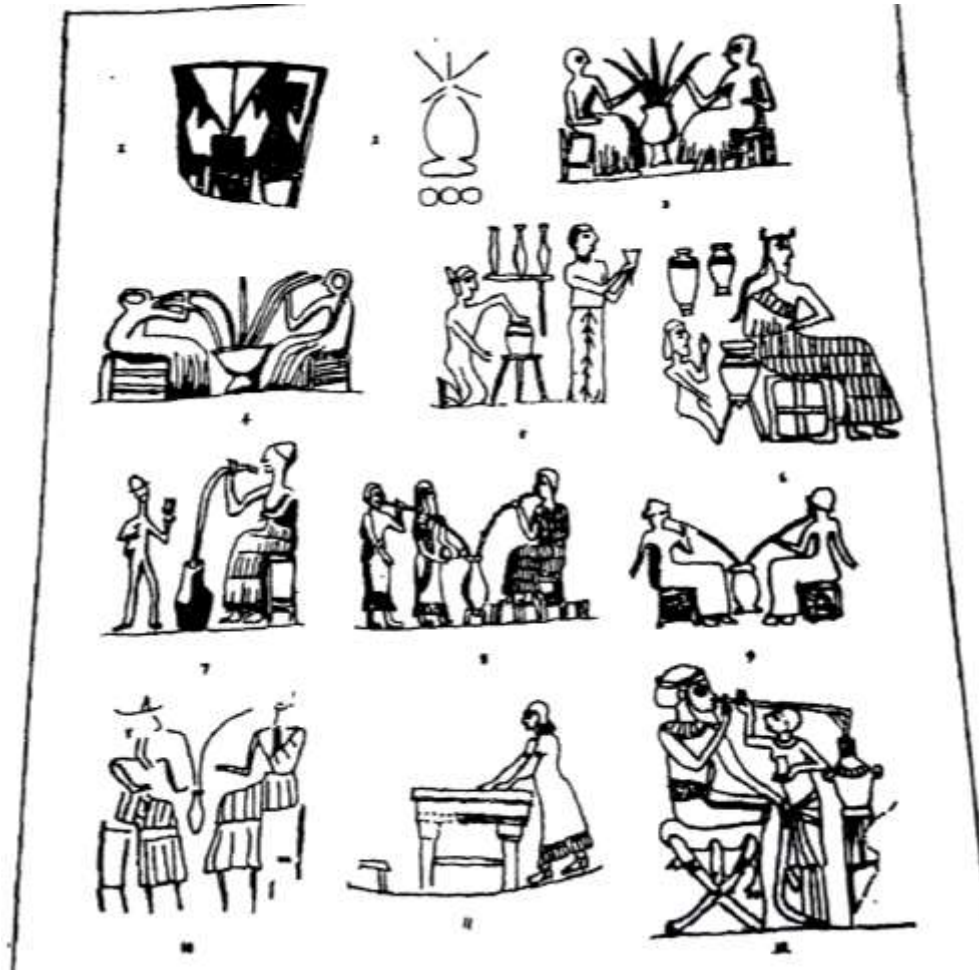
عملية صنع الجعة منقوشة على الاختام الاسطوانية نخبة من الباحثين العراقيين ، حضارة العراق ج ٣ ص ٣٤٩